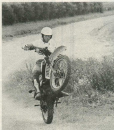
La pêche grande ouverte, et puis...

Reste que les possesseurs de 250 XT qui s'ennuient sur leur moto peuvent s'offrir un redoutable petit bolide rageur, bouillant et rudement marrant. Au fait, j'allais oublier : la 350 XT stade 2 donne à peu près 32 CV (à environ 8000 tr/mn)... la puissance de la 500 !