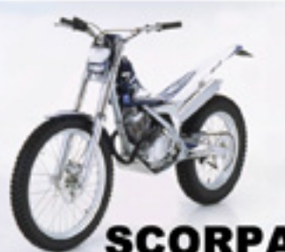
SCORPA 4 T TRIAL